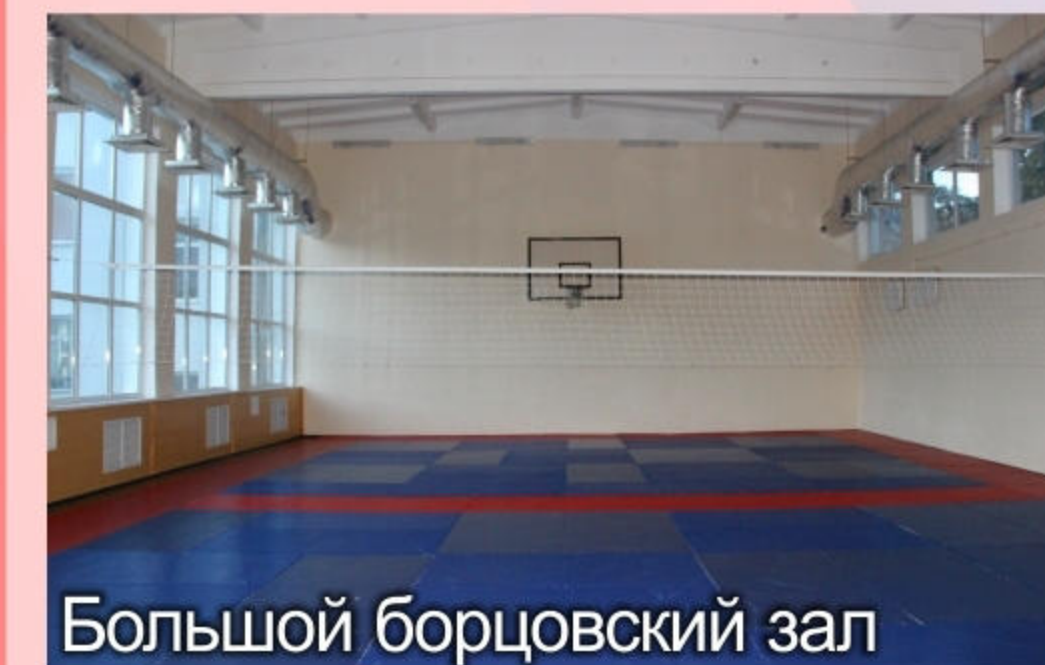
Большой борцовский зал